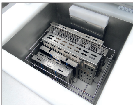
SONODYN 17-EK7 Contenance : 1 panier porte-cassette PC17 ou 1 panier P12 ou 2 paniers P3