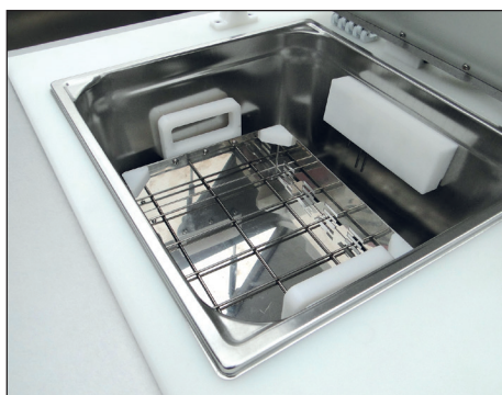
SONODYN 17-E Contenance : 1 panier P12 ou 2 paniers P3